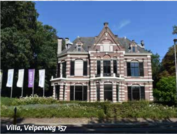
Villa, Velperweg 157

kreeg. Na de gemeentegrenswijziging van 1953 behoort het pand tot de gemeente Arnhem en staat het dus in "onze" wijk. Een bijzonderheid van het in neorenaissancestijl opgetrokken gebouw is dat één zaal een